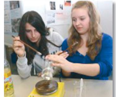
Begeisterung bei den Schülerinnen