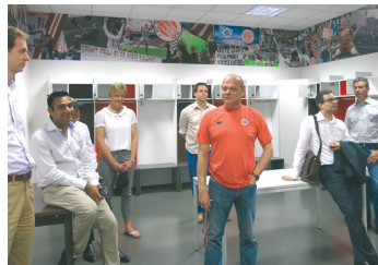
Besuch in der Kabine

war die Besichtigung der Séparées – ebenfalls mit schönen Insiderinformationen untermalt – ein Highlight der Veranstaltung. Insbesondere das Astra-Séparée, das die verbindenden Elemente der beiden Marken FC St. Pauli und Astra – die Heimat auf dem Kiez, ihren Underdog-Status und das gute Herz – widerspiegelt. Hier erhielten