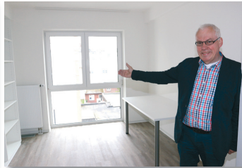
Die neuen Studentenwohnungen laden ein!