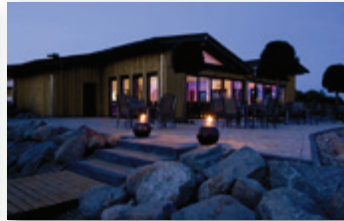
Das Clubhaus am Abend