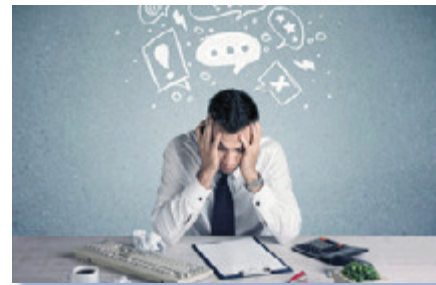
Aufnahme und Integration sind eine Herkulesaufgabe.

Darüber hinaus verweisen wir auf die OPEN ARMS , eine gemeinnützige GmbH. Sie bietet in Harburg, im Tempowerkring 6 u.a. monatliche Workshops rund um das Thema Flüchtlinge und Integration an, bei Bedarf können Themenwünsche für weitere Veranstaltungen eingebracht werden. Mehr unter: www.Open-Arms.net