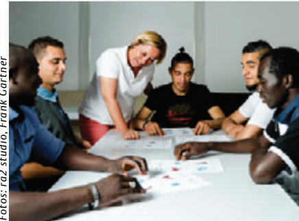
Gemeinsame Vorbereitungen helfen.