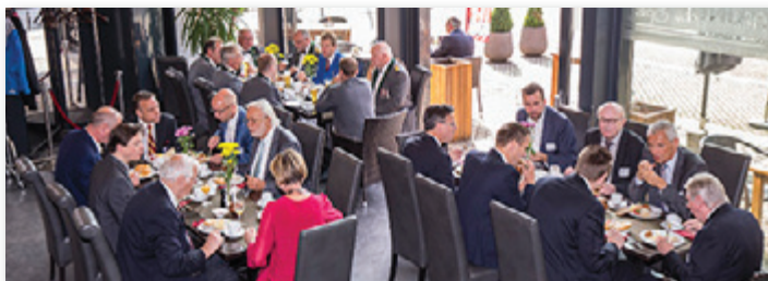
Gemeinsames Frühstück in der Helms-Lounge

Starke Präsenz beim Harburger Vogelschießen